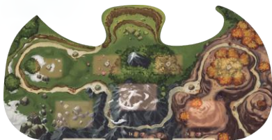
1 поле Острых хребтов