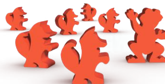
6 фишек лис и 1 фишка посла-лягушки (для дополнения «Жемчужный ручей»)