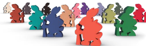
12 фишек зайцев-исследователей (по одному на каждый тип существ в базовой игре и в дополнениях)