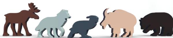
5 фишек крупных существ