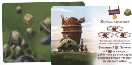
33 карты открытий