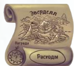
6 стартовых жетонов маршрута