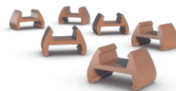
6 пластиковых сёдел (1 запасное)