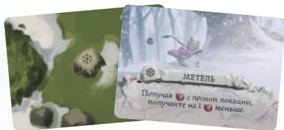
12 карт погоды