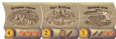
24 жетона маршрута